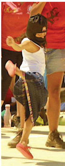
Niña danzando en medio de un partido de basquetbol durante el Primer Encuentro Internacional, Político, Artístico, Deportivo y Cultural de Mujeres que Luchan, marzo de 2018.